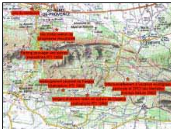
Localisation des sites visités

Le CRPF est néanmoins confronté à problème de