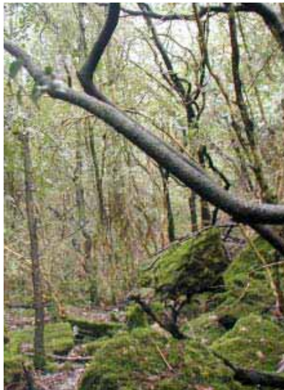
Forêt de fonds de vallon