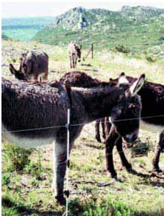
Anes utilisés pour consommer la végétation basse en vue de contrôler les combustibles

Les aménagements dans le cadre de la RTI ont plusieurs objectifs de gestion territoriale et sont entrepris en synergie avec Natura 2000, la Directive paysage et la charte du Parc naturel régional (qui prend en comp-