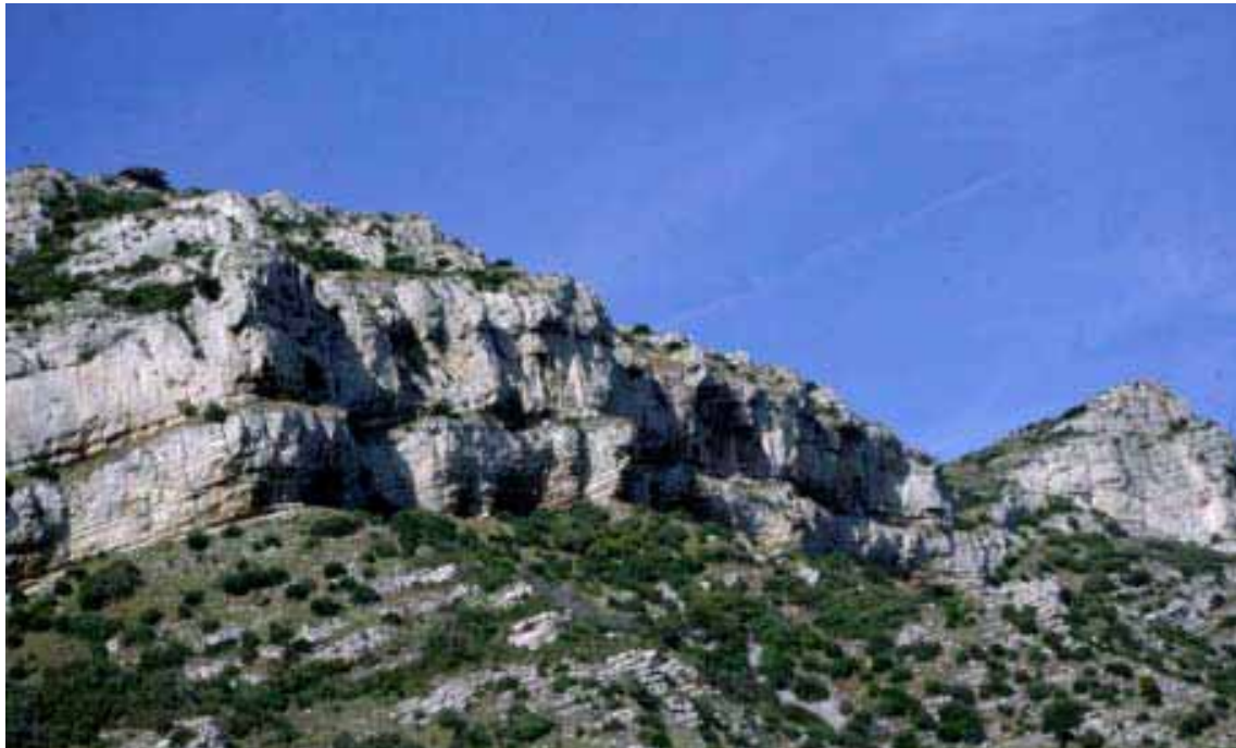
Falaises des Alpilles

12 à 18 % des causes de départ des feux sont liés à la foudre. Les travaux d'aménagement pourraient contribuer à préparer les forêts à recevoir les incendies tous