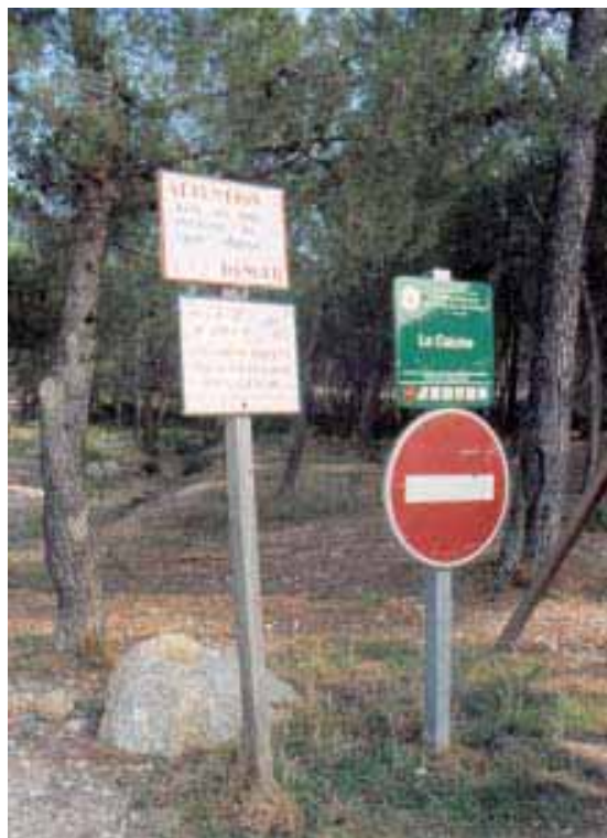
Parking paysager des Plaines