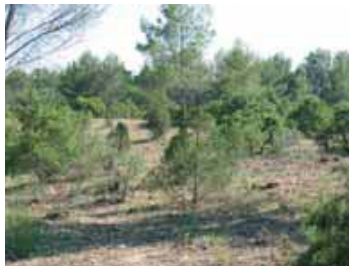
Maintien des formations de genévriers après extraction des pins.