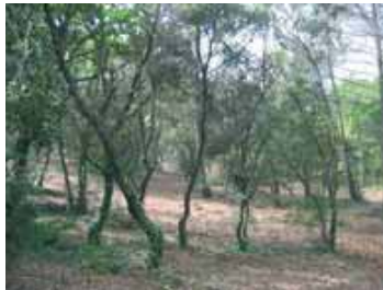
Maintien de sous-bois de chênes verts après extraction des pins.