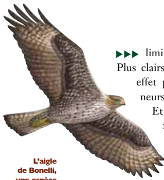
L'aigle de Bonelli, une espèce emblématique des Alpilles, qui profitera des actions d'ouverture du milieu de ce programme

►►► limite pas au seul risque incendie. Plus clairsemés, les sous-bois sont en effet plus accessibles aux promeneurs en période de risque faible. Et la diversité biologique peut à nouveau prospérer, dans un environnement plus lumineux où la faune dispose d'une alimentation plus variée, notamment grâce à la réapparition de nombreuses espèces végétales jadis éliminées par la pénombre de la forêt.