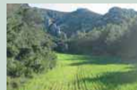
Couper des pins en appui et en continuité des zones agricoles du piémont.

Elisabeth Vérème , propriétaire à Saint-Rémy-de-Provence concernée par les travaux Recoforme