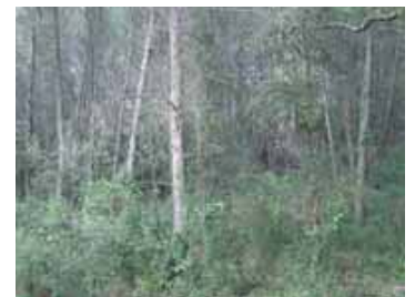
Avant travaux : Pinède très dense, extrêmement inflammable et combustible, en plus d'être assez pauvre d'un point de vue écologique.