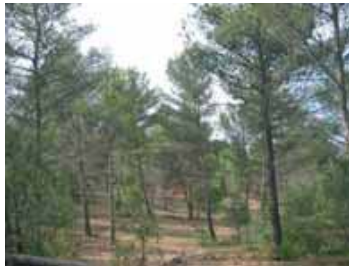
Eclaircie forte des pins dans un but paysagé adapté à la prévention des incendies.