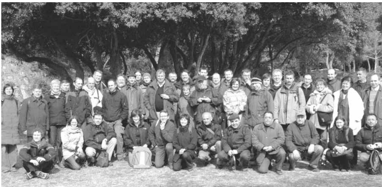
Délégués nationaux des 26 pays membres de l'Action COST E27 à de la tournée de terrain de la conférence finale de Barcelone

✓ En ce qui concerne le volet écologique de la mise en réseau, les représentants du projet ont insisté sur le rôle qu'occupent les espaces forestiers protégés en tant que points de connexion pour le développement de couloirs naturels. Ces couloirs seraient un moyen intéressant pour l'accroissement de la biodiversité.