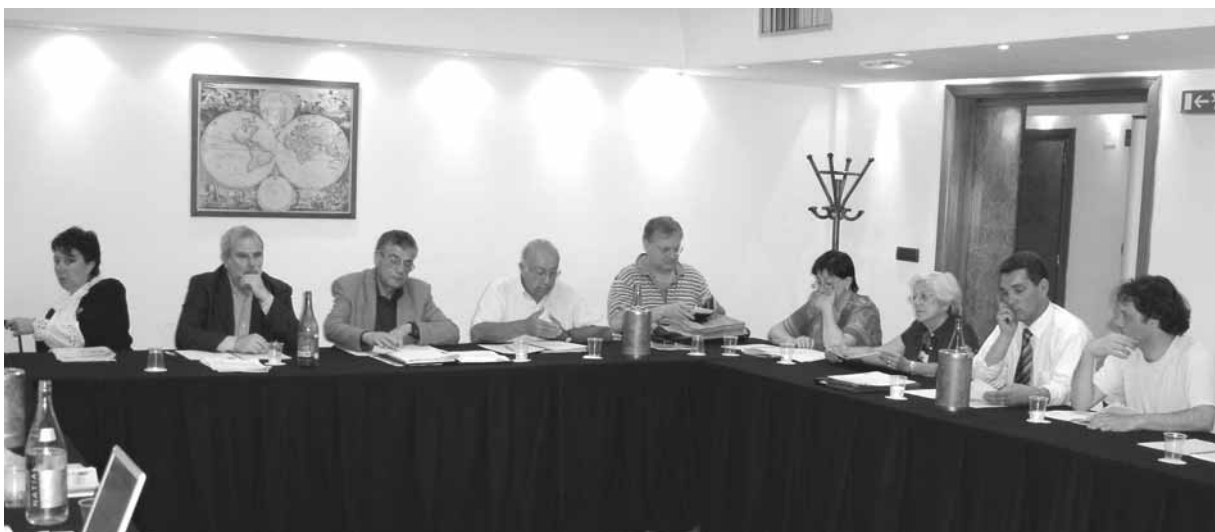
Participants à la XI ème Assemblée générale de l'AIFM

Pour une information exhaustive sur les rapports et documents présentés à la XI ème Assemblée générale de l'AIFM, nous renvoyons nos lecteurs au site www.aifm.org où ils pourront télécharger ces documents en ligne.